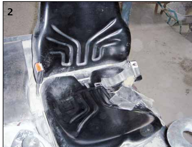
▲ Der Stapler war mit einem Sicherheitsgurt ausgerüstet, den der Fahrer jedoch nicht benutzte.