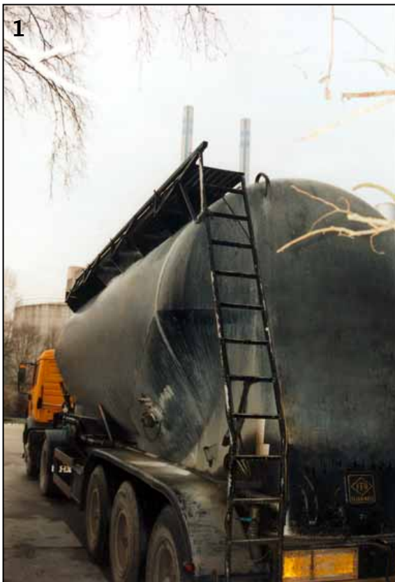
◀ Von diesem Sattelaufleger stürzte der Lkw-Fahrer in den Tod.