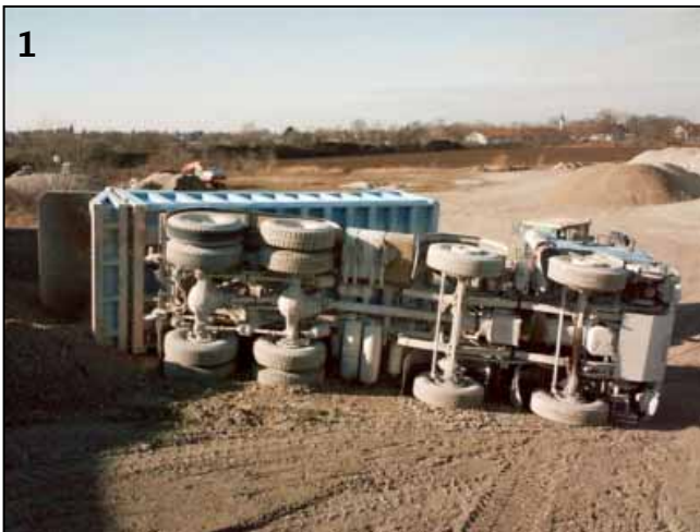
1 ▲ Beim Abkippen stürzte der Lkw zur linken Seite um.