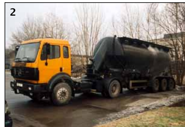
◀ Mit dem Rücken zum Fahrzeug stieg der Mitarbeiter die Leiter am Siloaufleger herunter. Dabei blieb er unglücklich mit seinem Schnürsenkel hängen und stürzte seitlich ab.