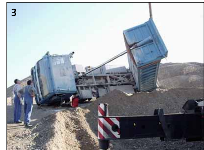
3 ▲ Die Schwerpunktverlagerung beim Abkippen und das Überrollen eines Materialhaufens haben den Riesen von den Rädern gehiebelt.