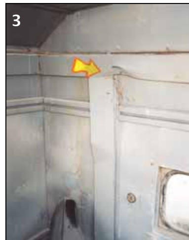
◀ Hier wurde ein Mitarbeiter mit dem Kopf gegen die Fahrzeugwand geschleudert und schwer verletzt.