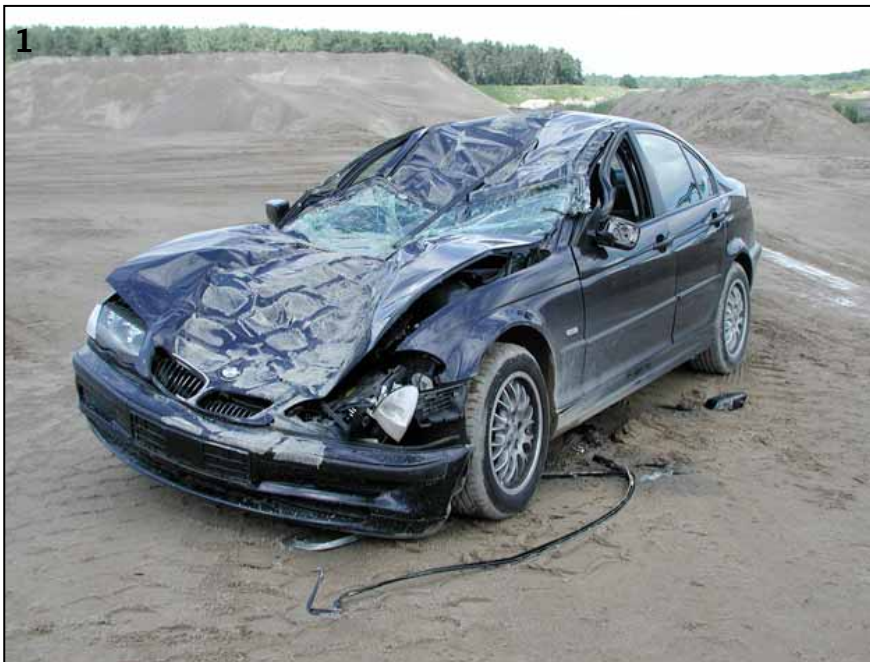
▲ Vorsicht: Kunde unerlaubt in Kiesgrube unterwegs. Damit hatte der Radladerfahrer nicht gerechnet. Der tonnenschwere Radlader fuhr rückwärts bis auf das Dach des BMW.