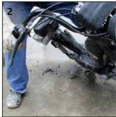
▲ Gefährliche Rutschbahn durch Staub und Klinker vom Förderband: Beim Abbiegen bricht das Mofa plötzlich aus.