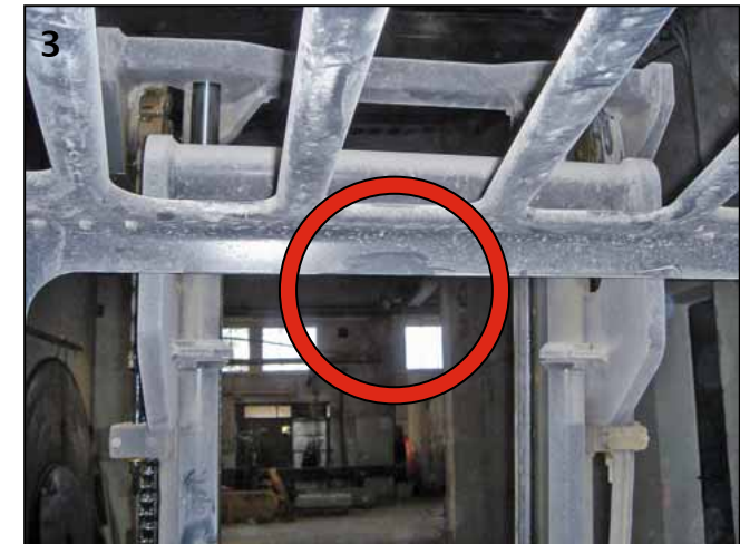
▲ Der Fahrer wurde mit dem Kopf gegen diesen Querholm des Rahmens geschleudert.