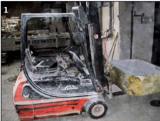
▲ Mit diesem Stapler transportierte der Staplerfahrer die Steinblöcke innerhalb der Halle.