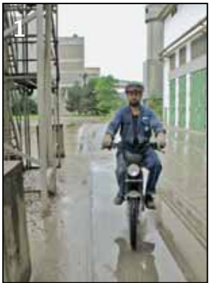
▲ Dringender Einsatz am Morgen: Ein Mitarbeiter schnappt sich das Mofa und fährt los. Die Wege sind uneben und nass.