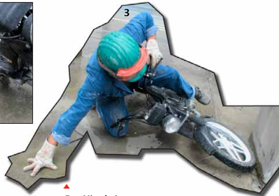
▲ Der Mitarbeiter stürzt und prallt mit dem Vorderreifen gegen einen Betonpfeiler.