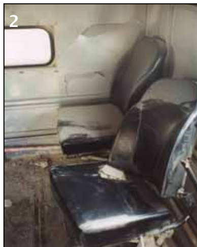
▶ Bei dem Unfall wurden sogar Sitze aus der Verankerung gerissen.