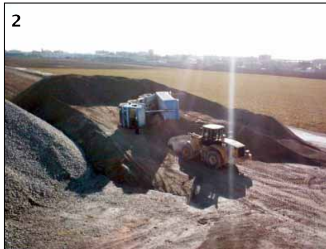
2 ▲ Augenzeuge des Unfalls und Ersthelfer vor Ort war der Kollege im Radlader.