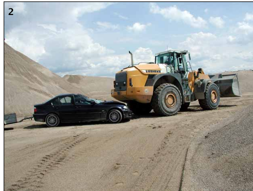
▲ Beim Rückwärtsfahren ist die Sicht des Radladerfahrers nach hinten gleich null.