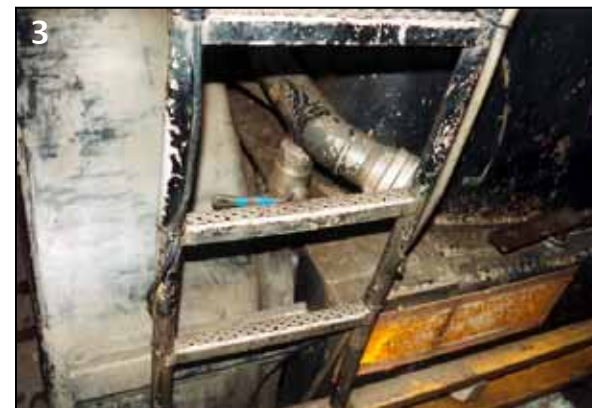
◀ Die Leiter des Siloauflegers befand sich in ordnungsgemäßem Zustand.