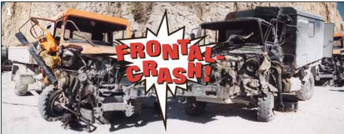
◀ Totalschaden bei beiden Unimogs.