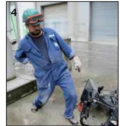
▲ Alles noch mal gut gegangen - dieser Sturz hätte auch schlimmer enden können!