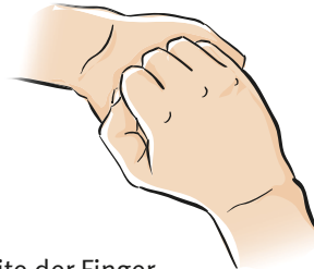
Schritt 5 Außenseite der Finger auf gegenüberliegende Handfläche mit verschränkten Fingern (fünf Mal)