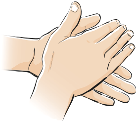
Schritt 1 Handfläche auf Handfläche