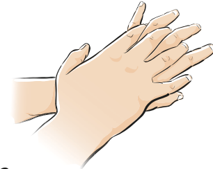
Schritt 3 Rechte Handfläche über linkem Handrücken und linke Handfläche über rechtem Handrücken (fünf Mal)