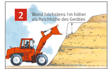
Gewinnung mit Schaufellader