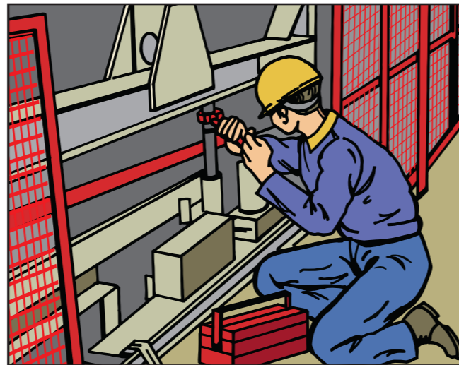
Durch vorbeugende Instandhaltung den störungsfreien Betrieb der Anlage gewährleisten