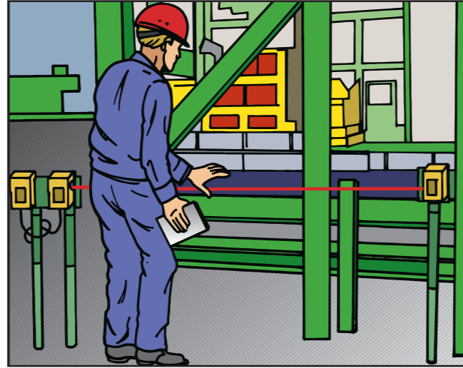
Regelmäßig wiederkehrende Funktionsprüfung der Sicherheitseinrichtungen